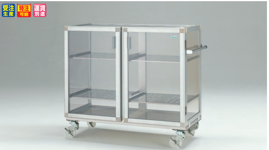
MW-400CK マグネットパッキン式 キャスター ※キャスターはウレタンタイプになります。