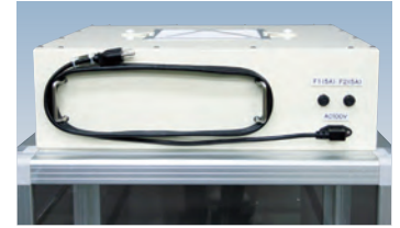
コンセントへ接続時は充電しながらファンを動作できます。