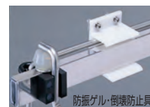
防振ゲル・倒壊防止具