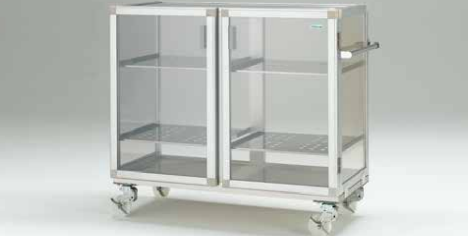
MW-400CK マグネットパッキン式 キャスター ※キャスターはウレタンタイプになります。