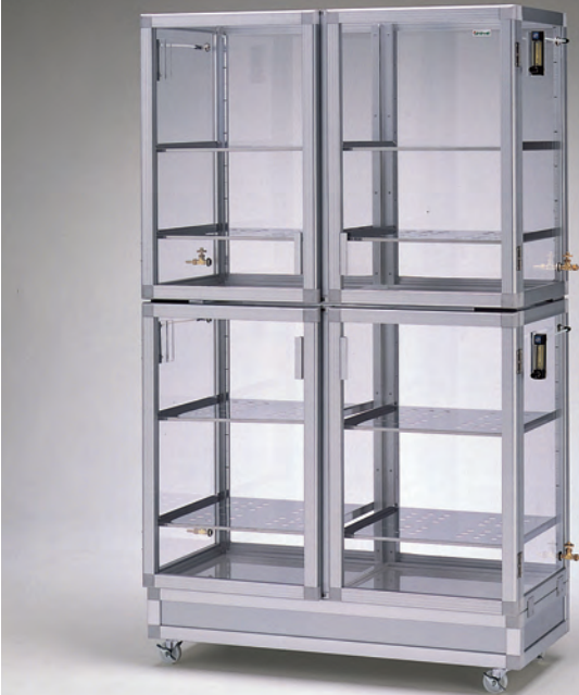
N-1804CX マグネットパッキン式 キャスター