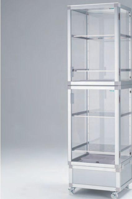
N-1802C マグネットパッキン式 キャスター