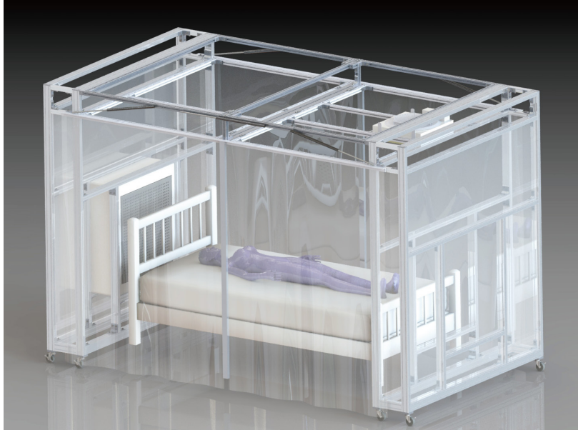
ブース内部を陰圧に保ち、ブース外部へのウイルス拡散を防止