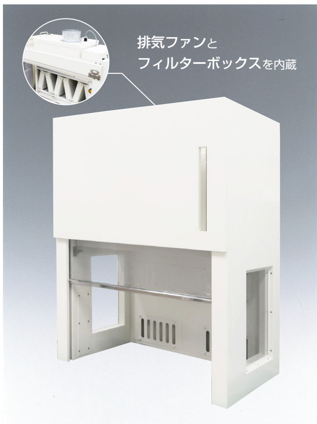
排気ファンと フィルターボックスを内蔵