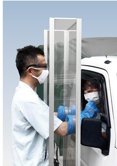
非接触で PCR 検査を行うことができる