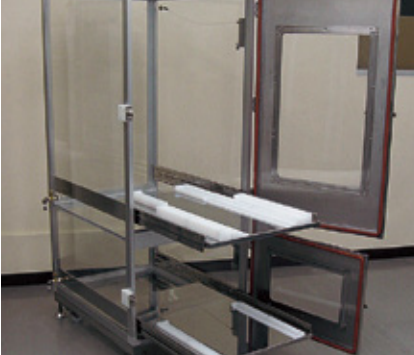
カセット収納 デンケーター

スライドレール棚のため、カセットの出し入れが容易に行えます。超高分子量ポリエチレン製のガイドレールはカセットに合わせて製作いたします。