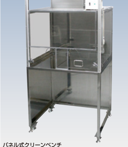
パネル式クリーンベンチ

ステンレス製の架台と一体型の簡易型クリーンベンチです。前面扉に手を入れるための切り込みがあり、扉を下げた状態でも作業が可能です。