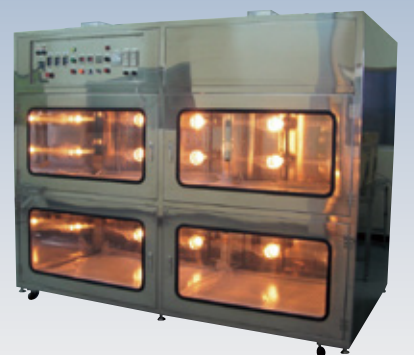
クリーンオープン

SUS304仕様により、クリーンな環境での使用に最適です。赤外線による昇温のため、ヒーター部位からの発塵がありません。ランプの点灯時間はタイマーで制御します。