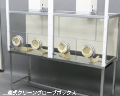
二連式クリーニンググローブボックス

二台をつなぐことで作業性を向上したグローブボックスです。前面が上下スライド式扉になっています。