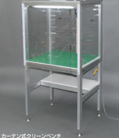
カーテン式クリーンベンチ