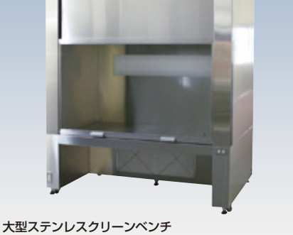
大型ステンレスクリーンベンチ

HEPAフィルターとケミカルフィルターを搭載したステンレス製の大型クリーンベンチです。