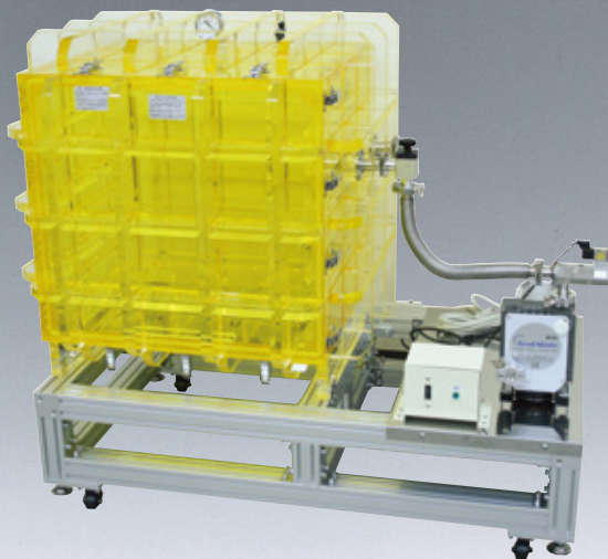
大型真空デシケーター(紫外線カット仕様 外寸: W1200×D700×H1102mm)