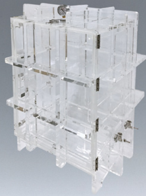
大型真空デシケーター(外寸: W670×D717×H940mm)